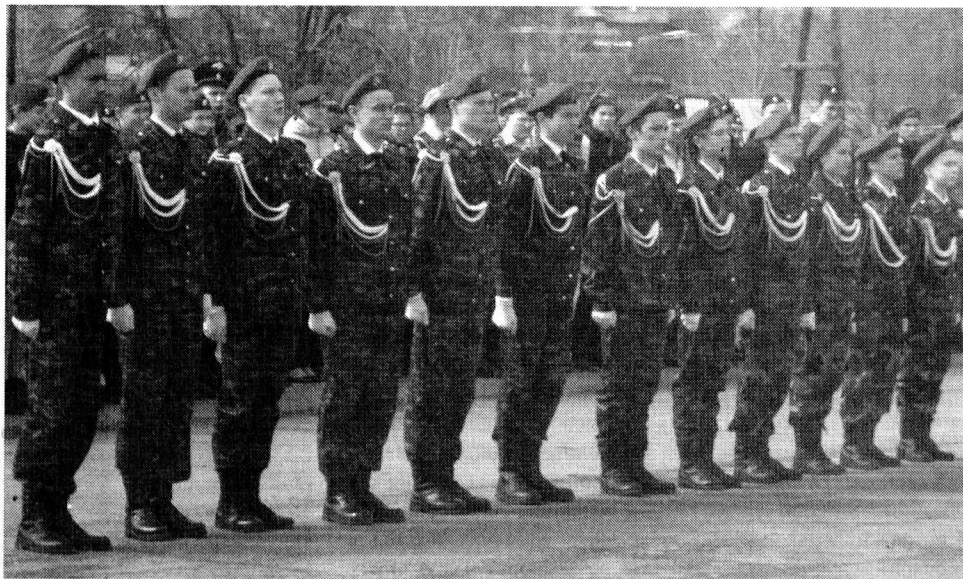
Команда «Орион» Киясовской школы.