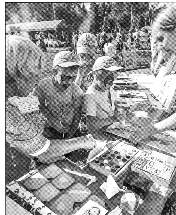
■ На зелёной площадке желающие могли внести свою лепту в создание тактильной книги «Времена года — загадки», предварительно пройдя мастер-класс специалистов Регионального центра организации библиотечного обслуживания слепых и слабовидящих граждан при НБ Удмуртской Республики

На зелёной площадке гости и участники фестиваля на мастер-классе «Тёплые книги» изготавливали тактильную книжку-игрушку для детей с нарушениями зрения. Данная акция проведена совместно с Региональным центром организации библиотечного обслуживания слепых и слабови-