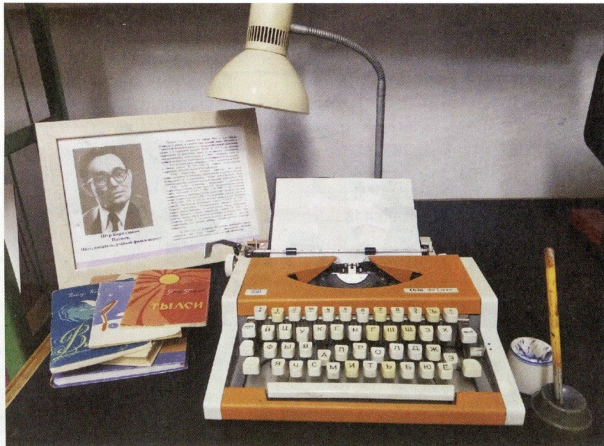
Эгра ёросысь Кабачигурт библиотекаын Пётр Поздеев писательлы сйзем сэрег.

– 2017-тй арын библиотекаен радъямы «Кытчык доры куное» дышетскон турмаршрут.