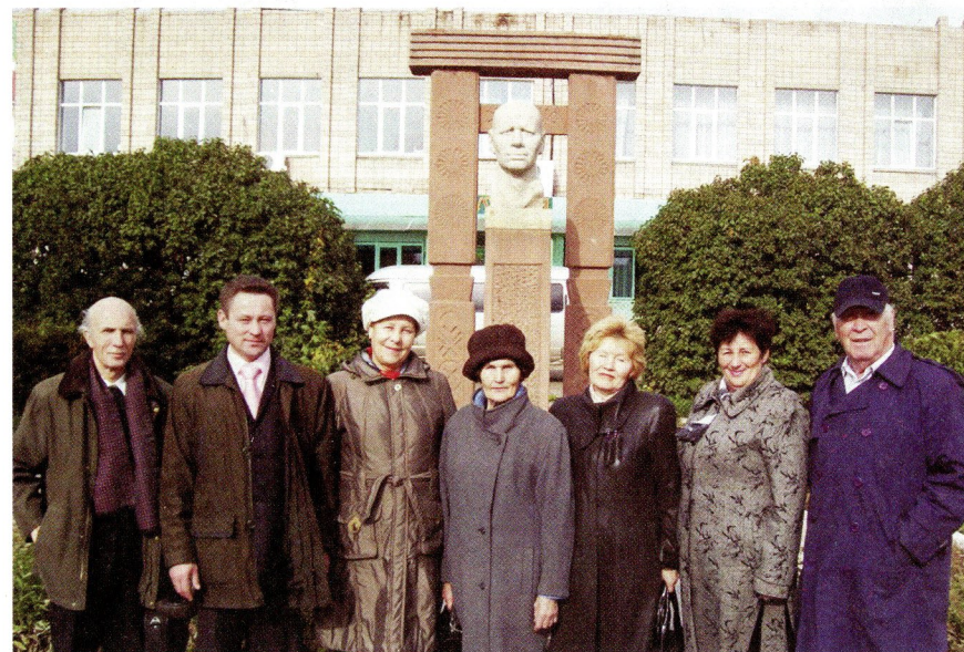
Эгра каргуртысь Кедра Митрейлы сйзем синпельмет дорын — элькунысьтымы лулчеберет но гожьяськем удысысь ужасьёс.

лыктэм калыкез нимысьтыз маршрутъя нуллыськем на: тодматйськем Кедра Митрейлы 1992-тй арын 100 арьем юбилеезлы сйзъыса вордйськем юртэз интые пуктэм синпельметэн, писательлэсь нимзэ нуллысь урамен (солэсь историзэ мадэ урамысь нырысетй ульсьёс Раиса но Николай Трониньёс), Кедра ошмесэн. Сое Кедра выжылэн ошмесэз шуыса кемаласен тодо ни — пырак Эграе пырон дорын ик бызе. Пичи Митрей но, малпаскем, та ошмесэ ветлэ вал, дыр, ошмес жильыртэм улсын ик, оло, нырысетй кылбур чурьёсыз но кылдйзы. Озы ик одно дугдылыськем на валэн почта нуллысьлы (ямщиклы) пуктэм синпельмет доры, уго писательлэн айиз ас вакытаз та ужез быдэсьям, — аспöртэм турмаршрутсы